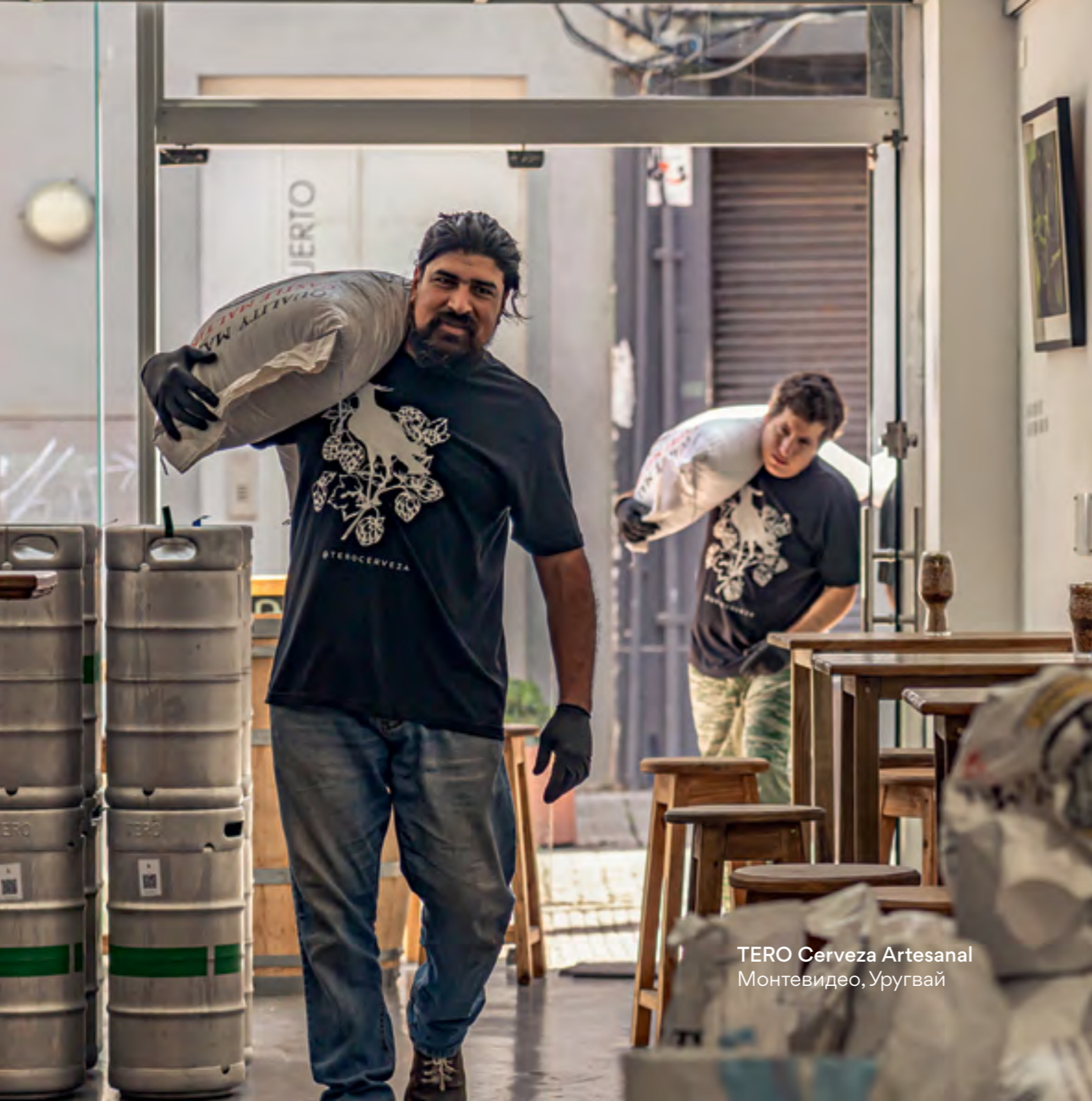
TERO Cerveza Artesanal Монтевидео, Уругвай