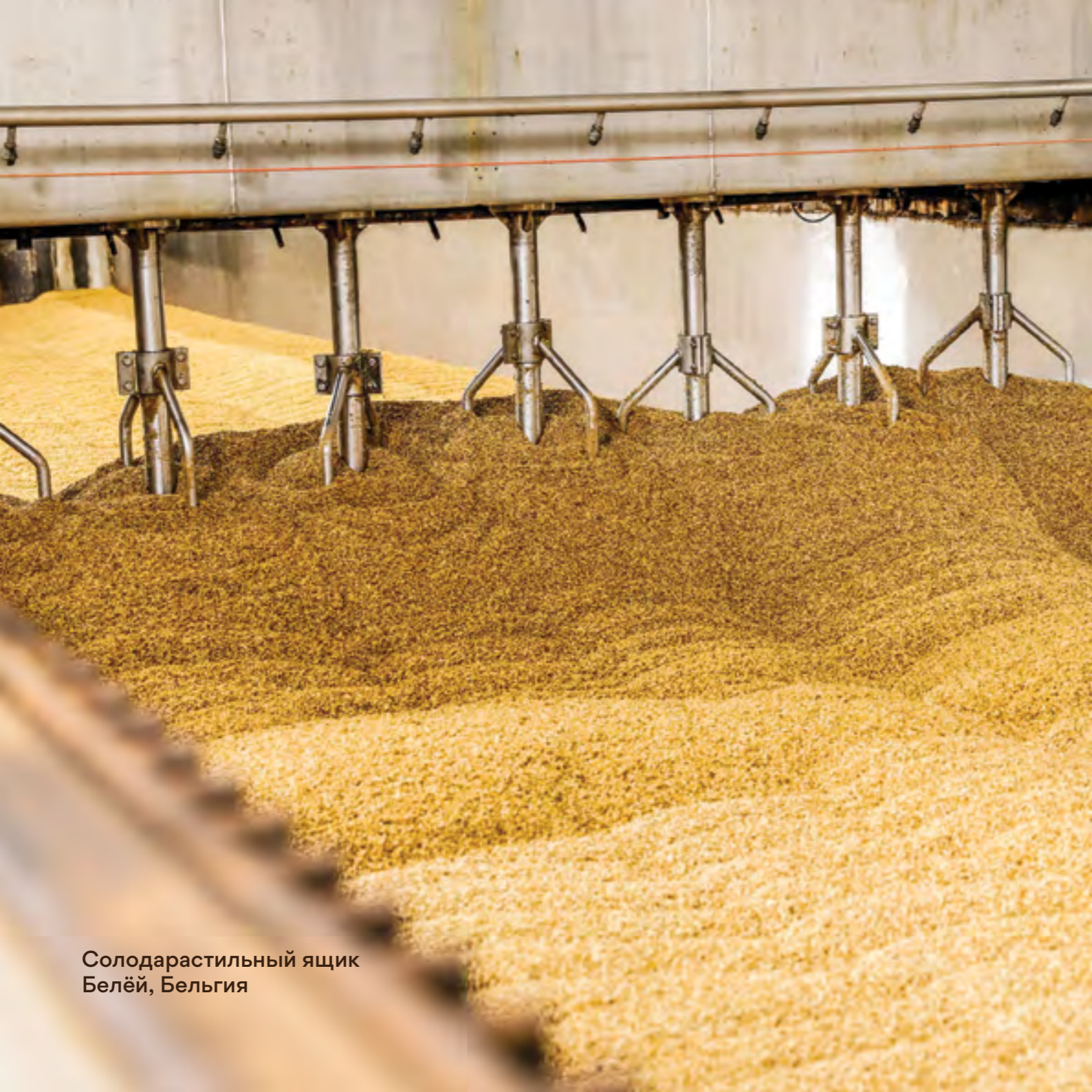
Солодарастильный ящик Белёй, Бельгия